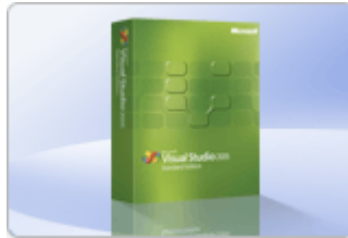
Slika 1.4. Visual studio 2008 Express

Microsoft-ov komercijalni razvojni alat Visual Studio (zadnja inačica 2008, u pripremi inačica 2010) koristi se za razvoj većih poslovnih aplikacija, te zahtijeva veće memorijske kapacitete i dugotrajnije učenje. Njegova jednostavnija i besplatna inačica – Visual Studio 2008 Express omogućava početnicima brže svladavanje programerskih vještina i razvoj manjih aplikacija za učenje i jednostavniju upotrebu.