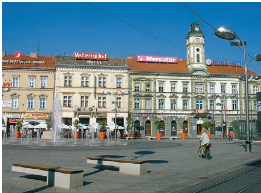
Gornji grad i Županijska ulica

Gornji grad nastao je početkom 18.stoljeća zapadno od Tvrđe preseljenjem djela stanovništva ispred zidina zbog potrebe gradnje nove urbane sredine. Grad se širio uzvodno uz rijeku Dravu. Tek krajem 19. Stoljeća razvoj grada kreće prema jugu. Gornji grad postaje glavni, središnji dio grada. Na tom području grade se županijska vjećnica, kazalište, župna crkva Sv.petra i Pavla, tvornica žigica i itd..